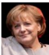
آنگلا مرکل (صدراعظم آلمان)