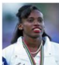
جکی جوینر کرسی (قهرمان دو و میدانی المپیک)