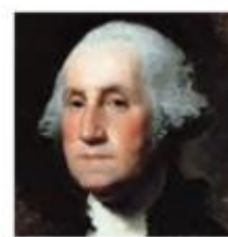
جورج واشینگتن (رئیس جمهور آمریکا)